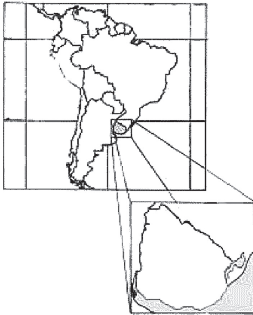
Mapa de Uruguay

En el presente capítulo vamos a analizar la trayectoria que describe, a lo largo del tiempo, la idea sobre la cocina uruguaya. En primer término, vamos a revisar lo que llamamos el “ciclo nacionalista”.