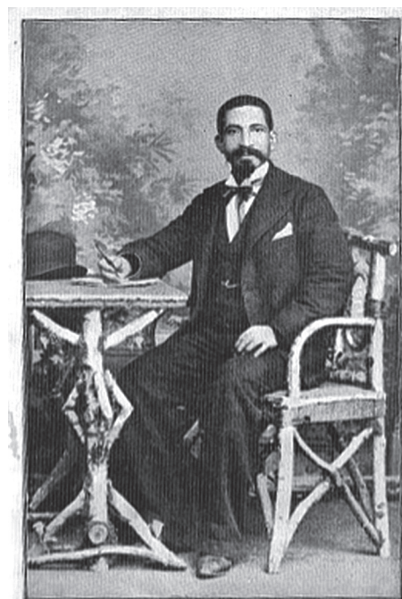
Francisco Figueredo, autor de los primeros recetarios del Río de la Plata

Arcondo señala que en la portada de la novena edición, se apostilla que Figueredo es “autor de los primeros y mejores libros de cocina y pastelería impresos en la República Argentina y en la República Oriental, adoptados por todas las familias, cocineros y cocineras” y agrega en referencia a la publicación que “nadie había pensado hacerlo aquí y en Montevideo, Chile y Brasil” (2002: 225).