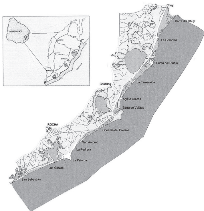
Complejo oceánico-lacustre en el departamento de Rocha