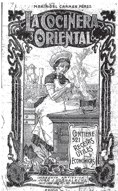
Portada de La cocinera oriental , publicada por primera vez en 1904

Se ha planteado la hipótesis de que las comidas y las cocinas nacionales fueron las primeras y