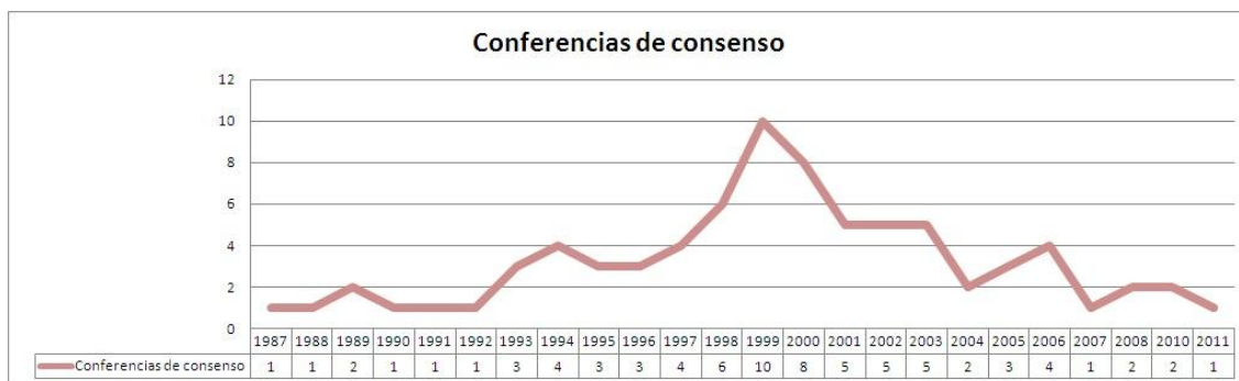
Figura 2: Realización de CC año por año desde 1987 al 2011.

Con respecto a la evaluación de las conferencias, existen muchos criterios a veces explícitos pero a menudo implícitos (Rowe & Frewer, 2005). La mayoría de las veces se focaliza en el impacto en el debate público y político concluyéndose en que posee escasos o nulos efectos en estas arenas (Guston, 1999). Pese a esta tendencia, existen experiencias que atestiguan el impacto potencial de las conferencias como lo demuestran Hudspith y Kim (2002) quienes identifican cómo fueron seguidas gran parte de las recomendaciones de un panel ciudadano en Ontario, Canadá. Por otra parte, Kleinman y colaboradores (2007) proponen una serie de metas y criterios para evaluar el éxito de la conferencia, entre ellas se destaca la diversidad de los participantes, la calidad del proceso del debate, el empoderamiento de los ciudadanos participantes y el impacto en el debate público y en la política.