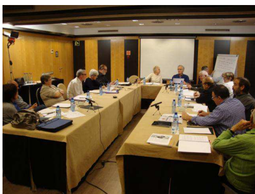
Figure 2.

"También me di cuenta de que los jóvenes estudiantes, además de cuidar de los micrófonos, observaban a la gente y escribían en sus cuadernos" (Extracto del participante 7 diario).