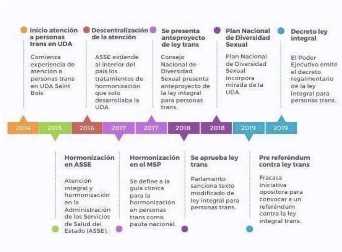
Figura 2. Línea de tiempo de hitos para institucionalizar el enfoque de la UDA en las políticas públicas (2014-2019)