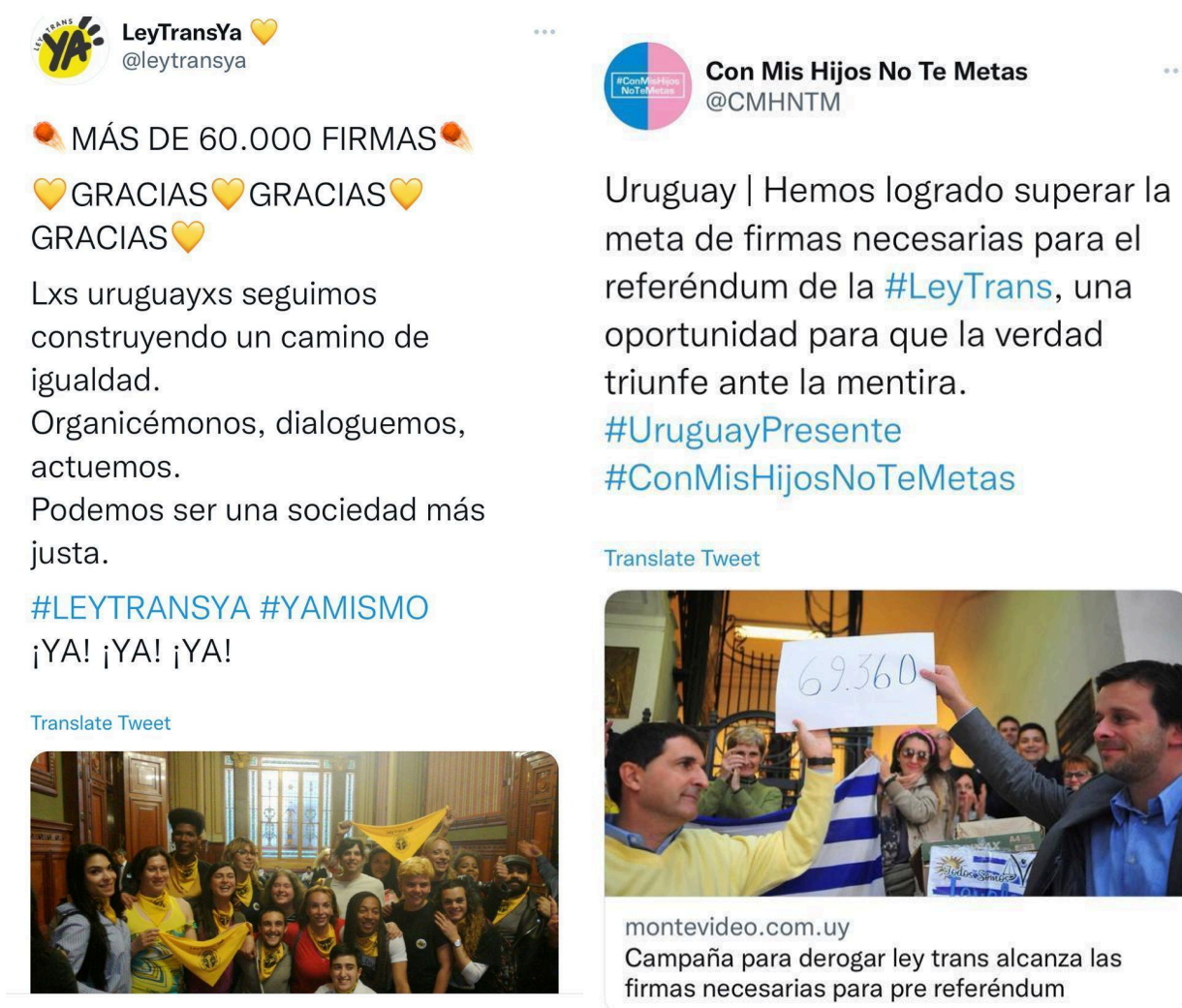
Figura 4. Imágenes en redes sociales de campañas de recogida de firmas de apoyo (izquierda) y de rechazo (derecha) a la ley